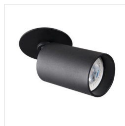
CHIRO GU10 DTO-B